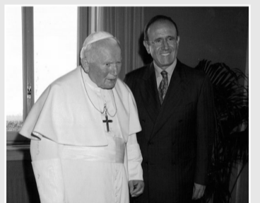
CON GIOVANNI PAOLO II