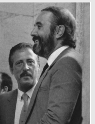
CON FALCONE E BORSELLINO