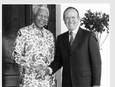
CON NELSON MANDELA