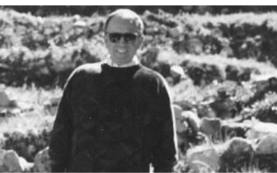
Pino Arlacchi in Bolivia

La vita umana non ha lo stesso valore nel centro e nella periferia della stessa città